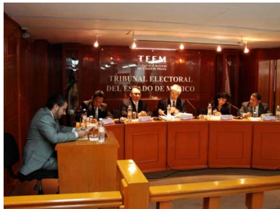
7ª Sesión Pública del Pleno del Tribunal Electoral del Estado de México.