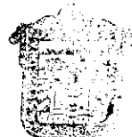
TRIBUNAL ELECTORAL DEL ESTADO DE MÉXICO