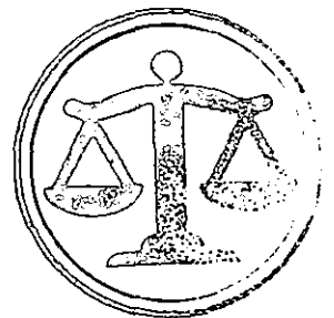
TRIBUNAL ELECTORAL DEL ESTADO DE MÉXICO