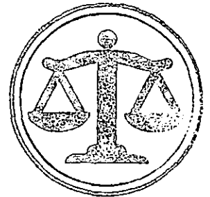
TRIBUNAL ELECTORAL DEL ESTADO DE MEXICO